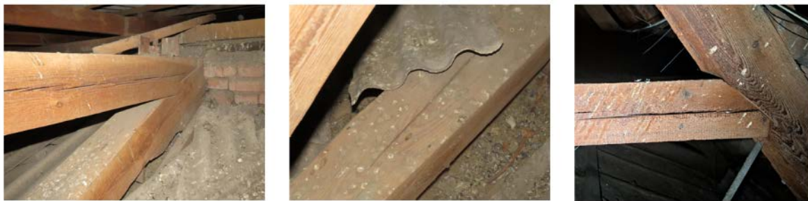
Рис.5. Тріщини від усушки деревини на елементах ферм

температурно-вологісних режимів протягом експлуатації, порушення вимог щодо вологості дерев'яних елементів, які використовувались при будівництві. Варто відмітити, що величини тріщин на дерев'яних конструкціях із більшим терміном експлуатації були більшими в порівнянні із більш «молодшими» аналогічними елементами.