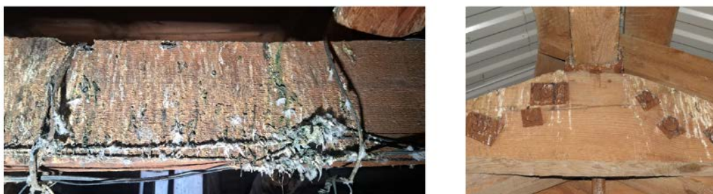
Рис.9. Загальний вигляд трикутних ферм типу 4

Додатково можна виділити пошкодження, які виникають внаслідок контакту елементів ферм із пташиним послідом (рис.9). На покрівлях часто трапляються випадки із пошкодженими слуховими вікнами, через які птахи мають доступ до горючого простору. Пташиний послід негативно діє на металеві елементи ферм і пришвидшує їх корозію.