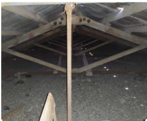
Рис.3. Загальний вигляд трикутних ферм типу 3

4) трикутні дерев'яні ферми – верхній, нижній пояс та решітка виконані із дерев'яних елементів (рис.4).