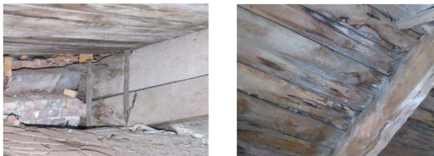
Рис.7. Сліди від систематичного зволоження деревини

На двох із десяти об'єктів були зафіксовані локальні ділянки із протіканням покрівлі. В даних місцях фіксувались зміна забарвлення деревини, розвиток грибків та розпочинались процеси гниття (рис.7). Варто відмітити, що в порівнянні із іншими виявленими дефектами, систематичне зволоження дерев'яних елементів у випадках відсутності ремонтів протікань нестиме найбільш негативний вплив на технічний стан ферм і значно знижуватиме термін експлуатаційної придатності