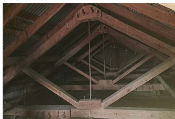
Рис.2. Загальний вигляд трикутних ферм типу 2

3) трикутні металодерев'яні – верхній пояс виконаний із деревини, нижній пояс із прокатних металевих елементів, елементи решітки із деревини та металу (рис.3);