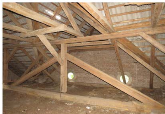
Рис.1. Загальний вигляд прямокутних дерев'яних ферм типу 1

2) трикутні металодерев'яні – верхній та нижній пояс виконані із деревини, елементи решітки – із деревини та металу (рис.2);