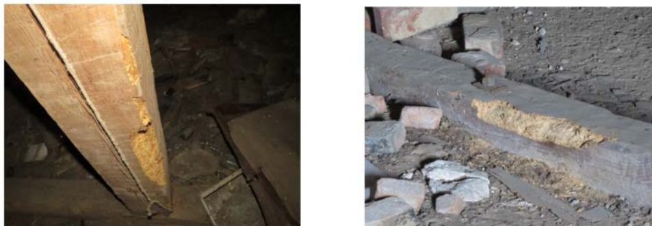
Рис.8. Ураження деревини жуками-деревоточцями

Додатково можна виділити пошкодження, які виникають внаслідок контакту елементів ферм із пташиним послідом (рис.9). На покрівлях часто трапляються випадки із пошкодженими слуховими вікнами, через які птахи мають доступ до горючого простору. Пташиний послід негативно діє на металеві елементи ферм і пришвидшує їх корозію.