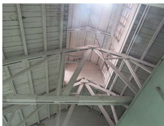
Рис.4. Загальний вигляд трикутних ферм типу 4

Згідно діючих будівельних норм України [19,20], найбільш поширеними дефектами дерев'яних конструкцій є: