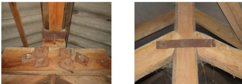
Рис.6. Корозія металевих елементів з'єднань

Одним із найбільш поширених дефектів також була корозія металевих елементів вузлових з'єднань (рис.6). Із збільшення віку елементів корозія мала більшу площу і глибину відповідно.