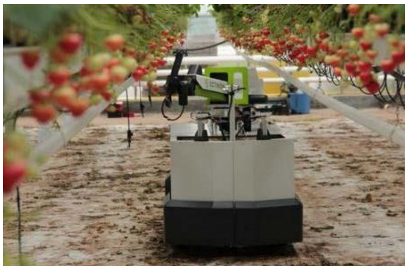
Рис. 3. Робот Rubion

Бельгійська робототехнічна компанія Oostinion запустила повністю автономного робота для збирання полуниці під назвою Rubion (рис.3). Робот автономно рухається по теплицям або полю, визначає ступінь стиглості ягід. Робочий орган робота здатен захоплювати ягоди з різним впливом на них (залежно від стиглості), що дає можливість зберігати їхню цілісність. Ще однією особливістю робота Rubion є здатність прогнозувати наступний урожай на основі аналізу даних про поточний врожай [14].