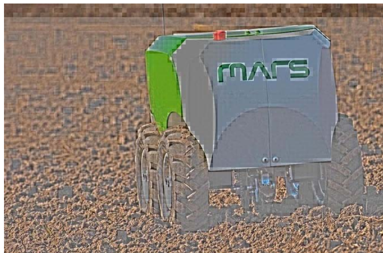
Рис. 5. Роботизована система MARS

Відомою також є роботизована система MARS (рис. 5), яка реалізує роеві принципи роботи. Роботи MARS призначені для виконання технологічного процесу висіву кукурудзи. Застосування роботизованої системи MARS дозволить замінити важкі агрегати (трактор і сівалка) й зменшити ущільнення ґрунту, а також споживання енергії важкою технікою. Крім того, запровадження роботизованої системи MARS призведе до зменшення витрат насіння, добрив та пестицидів і збільшення врожайності [16].