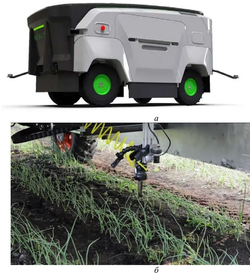
Рис.1. Робот для прополювання Nexus Robotics: а – загальний вигляд, б – робочий орган

На виставці Agritechnica 2025 компанія Fendt представила робота Xaver GT (рис.2) який призначено для боротьби з бур'янами на овочевих полях [13]. Ходова частина робота містить чотири колеса, які мають незалежне керування. У якості джерела енергії використано електродвигуни. Таке незалежне керування дає можливість з особливою точністю Fendt Xaver GT орієнтуватися в просторі. Робоча швидкість робота до 10 км/год. Робот точно визначає бур'яни, культурні рослини за рахунок використання штучного інтелекту. За добу робот здатен обробляти до 4 га. Згідно даних виробника та користувачів, економічний ефект від використання Nexus Robotics становить приблизно 1000 доларів з одного гектару.