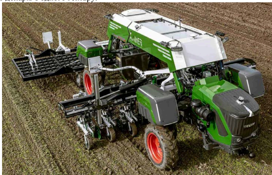
Рис.2. Робот Xaver GT

На виставці Agritechnica 2025 компанія Fendt представила робота Xaver GT (рис.2) який призначено для боротьби з бур'янами на овочевих полях [13]. Ходова частина робота містить чотири колеса, які мають незалежне керування. У якості джерела енергії використано електродвигуни. Таке незалежне керування дає можливість з особливою точністю Fendt Xaver GT орієнтуватися в просторі. Робоча швидкість робота до 10 км/год. Робот точно визначає бур'яни, культурні рослини за рахунок використання штучного інтелекту. За добу робот здатен обробляти до 4 га. Згідно даних виробника та користувачів, економічний ефект від використання Nexus Robotics становить приблизно 1000 доларів з одного гектару.