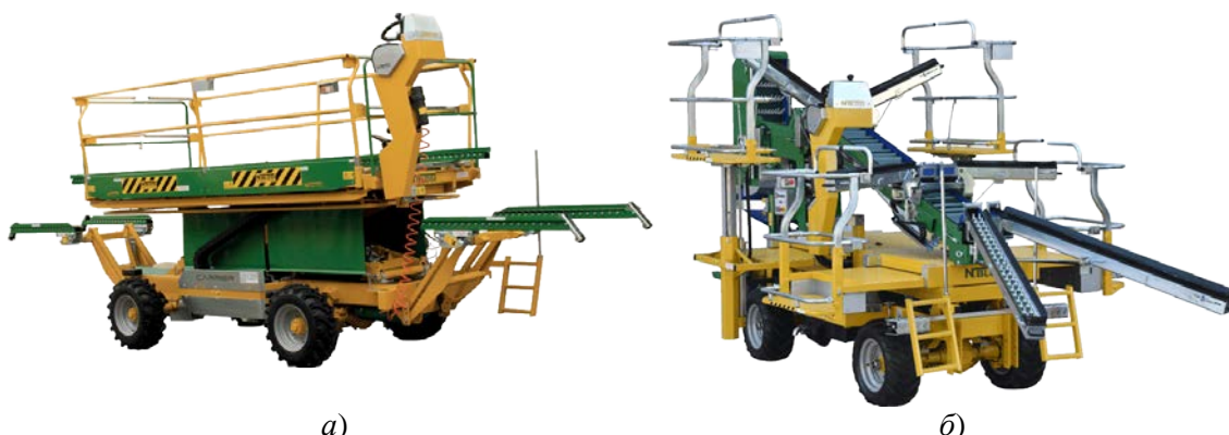
Рис. 3. Самохідні садові платформи Zip 30 фірми Blosi: а) – для детального обрізування крон плодових дерев; б) – для збиранні плодів

Використання такої техніки в поєднанні з пневматичним або акумуляторним інструментом дозволяє підвищити продуктивність у 1,5–2 рази та скоротити трудовитрати на 25–40%. Окрім економічного ефекту, робота із використанням платформи гарантує стабільну якість зрізу на всій висоті дерева та мінімізує зайві переміщення працівників у міжряддях [27].