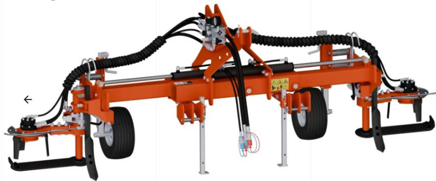
Рис. 1. Культиватор SICMA PRO-2

Для догляду за ґрунтом зразком універсальної модульної техніки є культиватор PRO-2 (рис.1) від SICMA S.p.A. (Італія). Він призначений для обробітку ґрунту в ягідниках, виноградниках та інтенсивних садах із міжряддями 1,75–3,8 м [29].