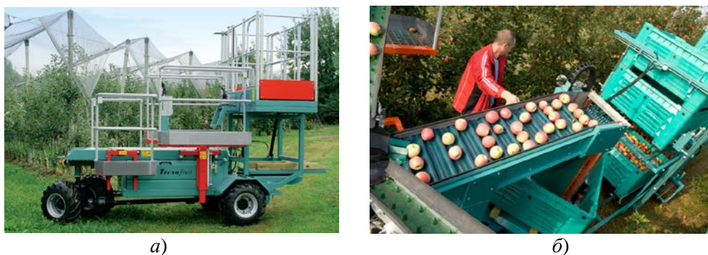
Рис. 4. Самохідна садова платформа Frumaco Tescnofruit CF 105: а) – загальний вигляд; б) – процес переміщення і наповнення контейнерів плодами.

Для роботи з контейнерами (встановлення, переміщення та розвантаження заповнених місткостей) передбачено спеціальний причіп (рис. 4, б). Самохідна платформа Tescnofruit CF 105 розрахована на групу до 6 осіб, а її продуктивність сягає 200–250 кг/год на кожного працівника [19].