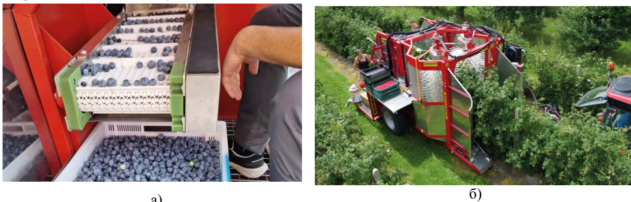
Рис. 5. Причіпний ягодозбиральний комбайн KAREN: а) – загальний вигляд в роботі; б) – сортування та очищення від сміття в комбайні

В університеті Монаша (Австралія) створили робота Apple Harvester для сканування садів і виявлення плодів. Під час роботи він аналізує колір і розмір кожного яблука, а також орієнтацію та розташування гілок. Робот знімає плоди за допомогою м'якого захвату чотирма «пальцями» з вакуумним приводом (рис.6, а). Це забезпечує мінімальне пошкодження врожаю та самого дерева, розпізнавати та збирати понад 90% плодів у радіусі 1,2 м, а на збирання одного яблука система витрачає менше ніж 7 секунд [24].