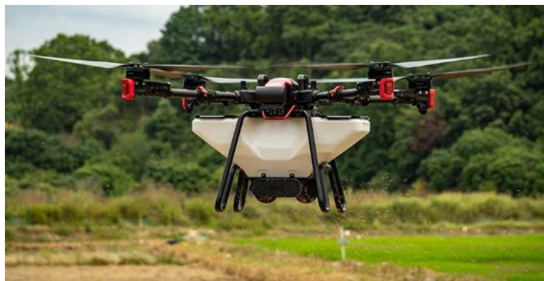
Рис. 2. Агродрон-обприскувач XAG P100 PRO

Для детального обрізування крон плодових дерев застосовують садові платформи, що забезпечують стабільний доступ до верхнього ярусу (на висоті 3,5 – 5,0 м) та створюють безпечні й комфортні умови праці. На українському ринку представлені причіпні моделі вітчизняного виробництва від ГК «Брацлав» і ТОВ «Агромаш-Калина», а також продукція фірми Agromasina S.A. (Молдова). Найбільш досконалою вважається універсальна самохідна італійська платформа Zip 30 фірми Blosi (рис. 3, а).