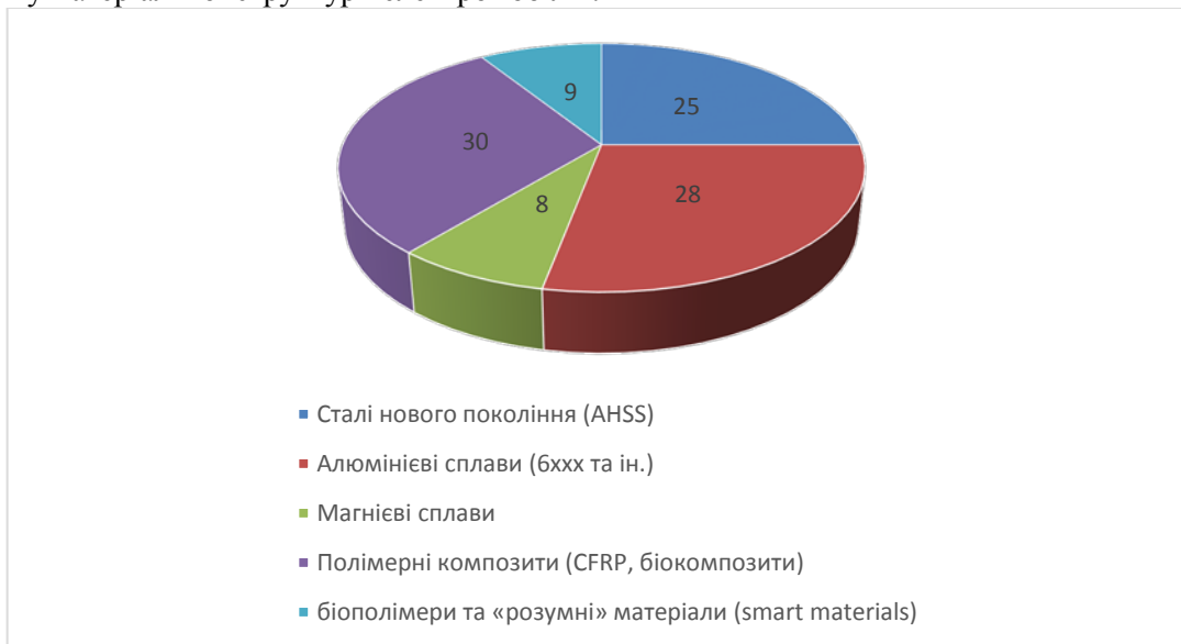
Рис. 3. Прогнозування структури матеріалів у виготовленні електромобілів на 2030 рік

Слід підкреслити, що наведені значення часток матеріалів до 2030 року мають інтервальний характер. З огляду на невизначеність економічних, технологічних та регуляторних факторів, похибка прогнозування може становити \pm 5-7\% для окремих груп матеріалів. Тому отримані результати слід трактувати не як точні значення, а як орієнтовні діапазони найбільш імовірного розвитку матеріальної структури електромобілів.