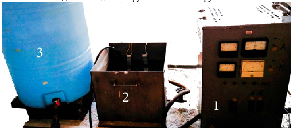
Рис. 1. Установа для синтезу ІМПЕЛОМ-1

Виклад основного матеріалу. Формування ОКП здійснювалося на імпульсній установці (рис. 1), яка складалась із джерела живлення та блоку регулювання струмів (1); електролітної ванни (2); холодильної установки (3). Анодом слугував досліджуваний зразок, катодом була електролітна ванна з нержавіючої сталі. За допомогою вольтметрів і амперметрів реєстрували залежність у часі значень анодної і катодної напруги та значення струмів.