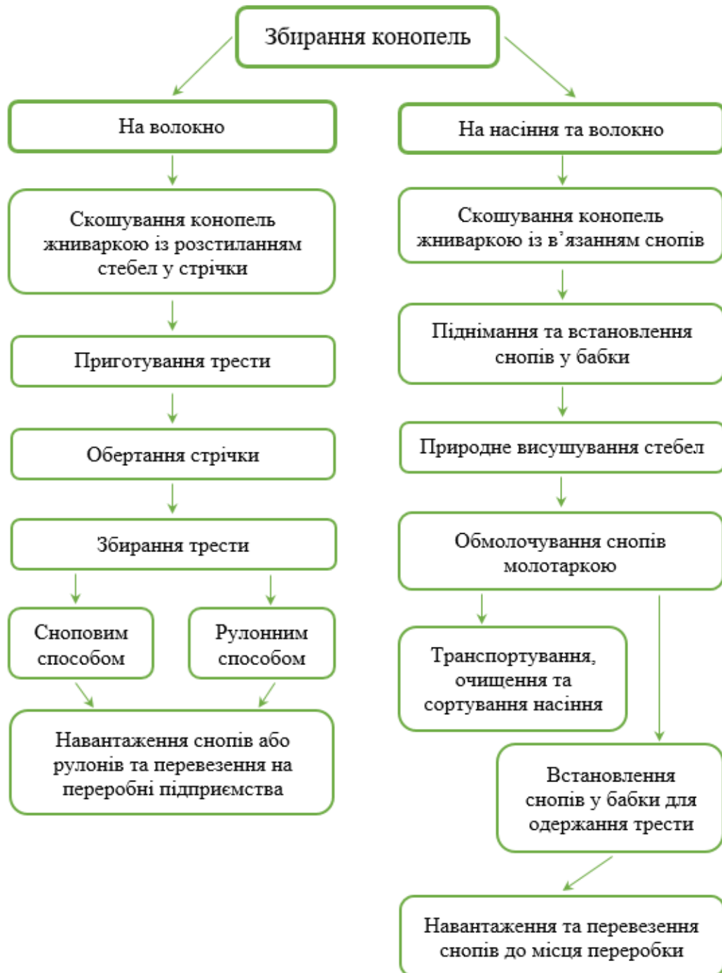
Рис. 1. Схематичне зображення сутності класичних технологій збирання конопель

пристрій ТК-1 для навантаження тюків, пристосування ППУ-0,5 для навантаження рулонів. Зазначений комплекс машин було розроблено Інститутом луб'яних культур в останні десятиріччя минулого століття [1, 2, 6, 7].