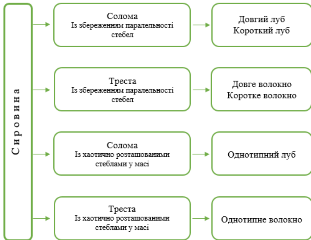
Рис. 5. Схематичне зображення можливих сценаріїв одержання сировини із стеблової частини рослини конопель

Відмітимо, що запропоновані нові технології збирання промислових конопель, поряд із добре відомими класичними, уможливають одержувати як насіння, так і сировину у вигляді соломи для виробництва довгого або однотипного лубу, тресту для виробництва довгого або однотипного волокна (рис. 5).