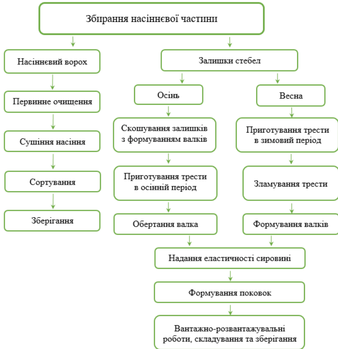
Рис. 4. Схематичне зображення технологій збирання промислових конопель

Згідно до запропонованої технології (рис. 4) процес збирання передбачає одержання насіння зернозбиральними комбайнами. Зрізану ріжучим апаратом на регламентованій висоті підйому жатки насінневу частину стебел обмолочують молотаркою комбайна.