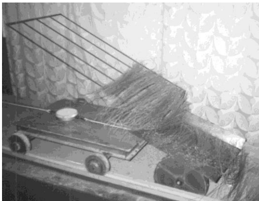
Рис. 3 – Визначення тягового зусилля приводу вивідного пристрою у лабораторних умовах

Висновки. Після аналізу одержаних результатів, виключення тягового зусилля на переміщення візка, встановлено, що тягове зусилля приводу вивідного пристрою під час роботи вхолосту становить для випадку, коли палець коромисла розміщувався біля центра обертання опорно-приводного колеса – 84,3 Н, а коли на периферії колеса – 87,8 Н. Коли ж вивідний пристрій виконує розстилення з одночасним підрівнюванням стеблової стрічки, то тягове зусилля приводу вивідного пристрою у першому випадку склало 109,2 Н, а в другому – 117,4 Н [2, 3].