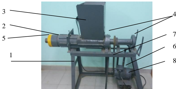
Рис. 2 – Дослідна установка шнекового дозатора

Для дослідження процесу дозування верхового торфу машиною для локального внесення його під посадку лохини, застосовували математичний метод планування експерименту із використанням симетричного не композиційного плану реалізації експерименту Бокса-Бенкіна другого порядку [4]. Метою експерименту було визначення коефіцієнту варіації маси дози матеріалу, виданої за одиницю часу при варіюванні таких факторів як вологість торфу, висота торфу у бункері, та кут нахилу осі шнека до горизонту.