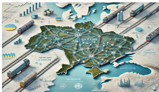
Рисунок 3. -- Візуалізація нових транспортних коридорів, які планують створити для зміцнення зв'язків України з Європою

Ось презентовані основні коридори та ініціативи, які розглядаються [9, 10]: