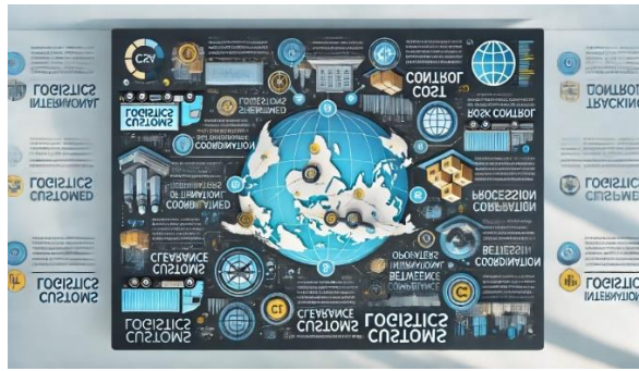
Рисунок 1. -- Інфографіка, яка візуалізує роль митної логістики в міжнародних перевезеннях.

Ось інфографіка, яка відображає ключові моменти комплексного підходу до управління порядком переміщення товарів через митний кордон України (рисунок 2). Вона включає етапи митного оформлення та методи оптимізації процесу, підкреслить комплексний підхід у транспортній логістиці для митного оформлення. Це може включати: етапи процесу митного оформлення (наприклад, підготовка документів, перевірка товару, розрахунок митних зборів, контроль на кордоні). Переваги комплексного підходу – ефективність, скорочення часу на оформлення, зниження витрат. Засоби оптимізації – технології для відстеження, автоматизація, цифрові системи обліку.