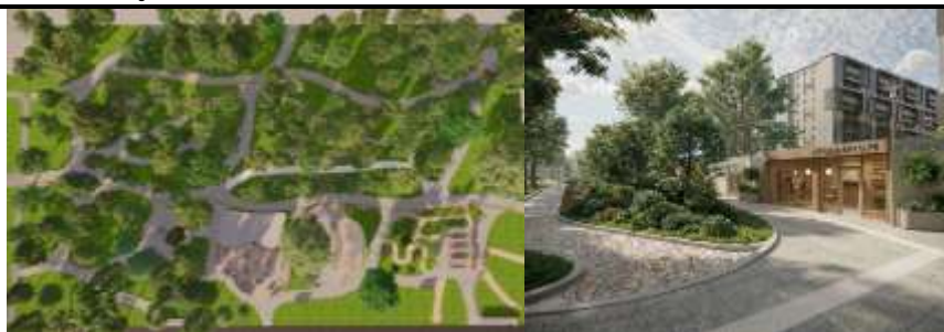
Рис. 4. Ізолююча зелена смуга

Міські городи та фруктовий сад виступають не просто як елементи озеленення, а як інструменти активної соціальної та фізичної реабілітації. На відміну від декоративних клумб міські городи дозволяють ветеранам та людям із порушенням моторики залучатись до ерготерапії, що в свою чергу допомагає долати бар'єри ізоляції та стимулює взаємодію між мешканцями і ветеранами (рис.5).