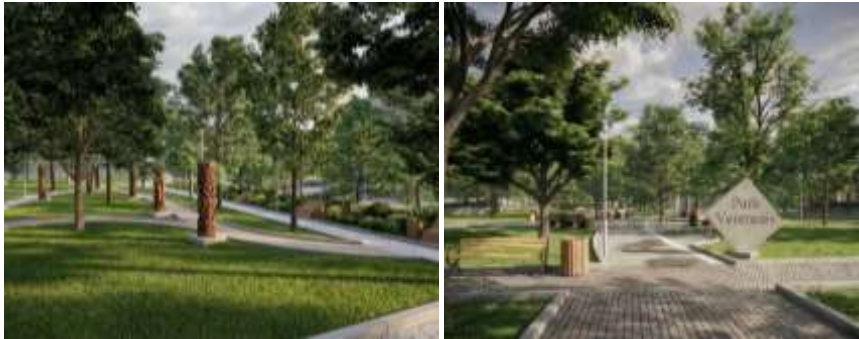
Рис. 6. Простір ветеранських робіт (один із можливих варіантів).

громадою кварталу що в свою чергу демонструє результати творчості (арт-терапії) ветеранів і дозволяє повернути відчуття значущості та інтегруватися в культурне життя Луцька. Це не просто зона зі скульптурами, а простір суспільної пам'яті та підтримки, спрямований на гідне вшанування захисників, формування поваги до їхнього досвіду та створення психологічно комфортного середовища для взаємодії з громадою (рис.5.).