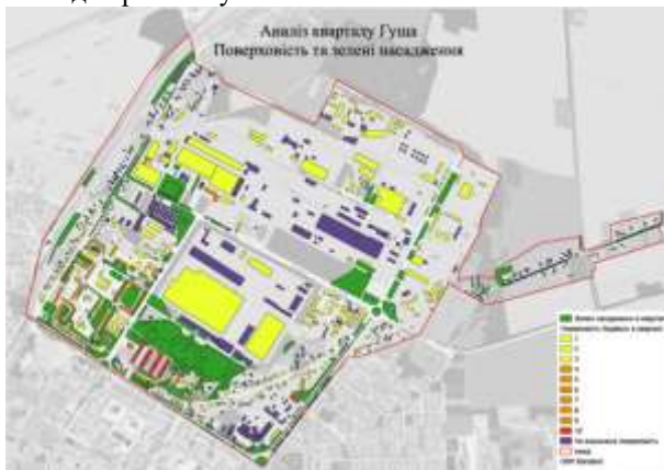
Рис.1. Просторовий аналіз поверховості забудови та зелених насаджень кварталу Гуша

Враховуючи дані Qgis аналізу була вибрана ділянка для подальшої ревіталізації та створення мультифункціонального скверу реабілітації (рис.2.).