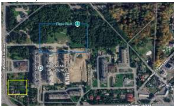
Рис. 2. Ситуаційна схема ділянки на мапі.

Дана ділянка розташована в парку льоно-шовкового комбінату (синій прямокутник) та знаходиться біля майбутнього ветеранського хабу (жовтий прямокутник).