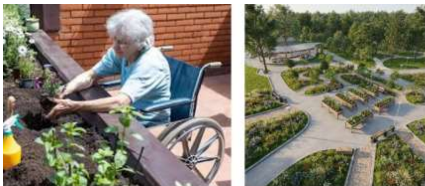
Рис. 5. Міські городи та фруктовий сад.

Міські городи та фруктовий сад виступають не просто як елементи озеленення, а як інструменти активної соціальної та фізичної реабілітації. На відміну від декоративних клумб міські городи дозволяють ветеранам та людям із порушенням моторики залучатись до ерготерапії, що в свою чергу допомагає долати бар'єри ізоляції та стимулює взаємодію між мешканцями і ветеранами (рис.5).