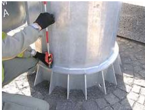
Рис.2. Фотофіксація процесу геодезичного вимірювання кренів споруди щогли

На основі складеного топографічного плану та результатів фіксації фактичного положення елементів щогли було розроблено спрощену схему просторового положення частин флагштока, а також визначено ймовірне положення закладної деталі вузла обпирання конструкції на фундамент (рис. 2,3).