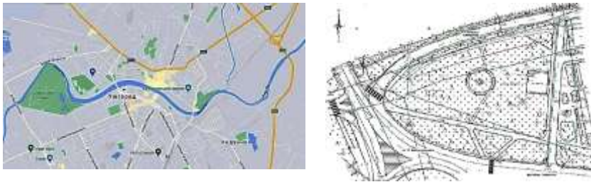
Рис. 1 Ділянка розташування досліджуваного об'єкту

Об'єкт обстеження розташований у межах озелененої території на перехресті вулиці Льва Толстого, проспекту Свободи та площі Богдана Хмельницького (рис. 1). Досліджувана споруда являє собою металевий флагшток висотою 30 м, виконаний у вигляді сталевий конічної полігональної щогли, що складається з трьох секцій. З'єднання секцій здійснено методом самонасаджування, що забезпечує необхідну просторову жорсткість та надійність конструкції. Захист металевих елементів від атмосферного впливу та корозійного ураження виконано методом гарячого цинкування.