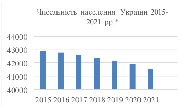
Рис. 1. Зміна чисельності населення України

* дані надано Державною службою статистики України, станом на 1 січня 2021 року без урахування тимчасово окупованої території Донецької і Луганської областей і без Автономної Республіки Крим з містом Севастополь [4]