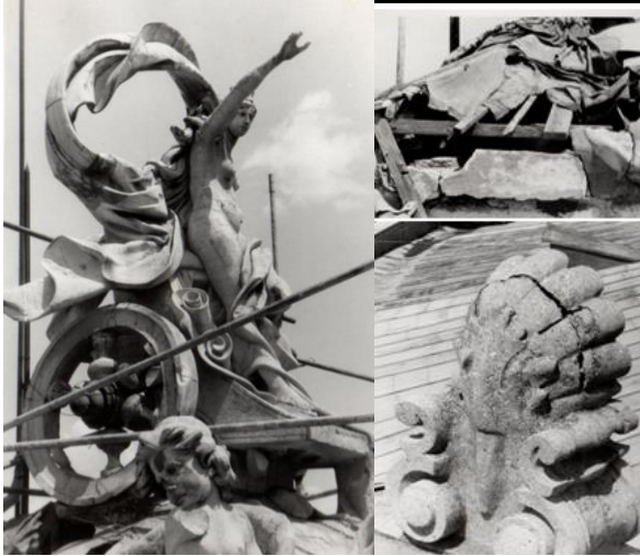
Рис. 1. Состояние скульптур Театра Оперы и балета 1992г.

совершенно не учли особенности морского климата и в силу этого достаточно агрессивной окружающей среды, и использовали в своих скульптурах обычную железную арматуру. Коррозируя стальные прутья, увеличивались в диаметре и просто разрывали статуи изнутри (рис.1) [2].