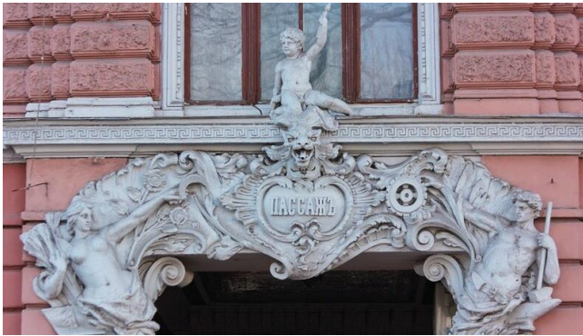
Рис.3. Внешняя часть арки Пассажа со стороны Дерибасовской

А на рис.3 фото внешней части арки Пассажа со стороны Дерибасовской. Тут тоже изображены Фортуна и Меркурий, но к ним в советское время приложились руки патриотичного скульптора (Фортуна приобрела серп, Меркурий молот и рабочий пояс).