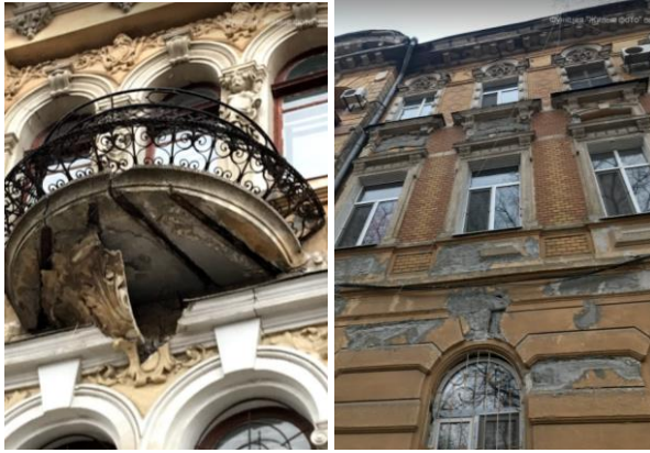
Рис. 4. Памятник архитектуры - Доходный дом Кефала, ул. Марзалиевская 44 и Марзалиевская 38. Разрушение лепнины

Причинами износа элементов лепнины в памятниках архитектуры являются: некорректность эксплуатации строения; деятельность человека; военные преступления; пренебрежение к фактическому распределению напряжений в отдельных элементах; влияние атмосферных осадков; неравномерное увлажнение грунтов основания, которое вызывает осадку фундаментов; воздействия от морозного пучения; влияние рельефа местности, инсоляция; влияние от сейсмических воздействий, вибрация от проходящих вблизи поездов, автотранспорта и т.д.; коррозия металлических креплений, потеря несущей способности связей; изменение конструктивной схемы сооружения, вызванное пристройками.