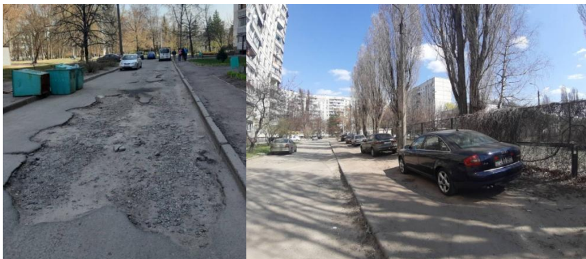
Рис. 2. Стан дорожнього покриття та місць для паркування у житловій групі