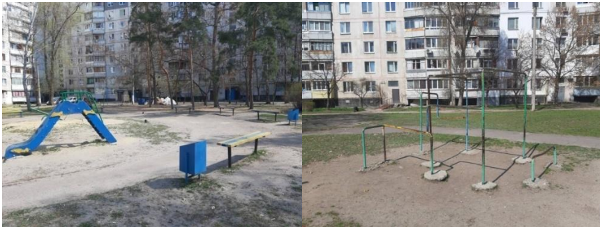
Рис. 3. Стан дитячих та спортивних майданчиків у житловій групі

Проаналізувавши відповіді мешканців будинків, можна виділити такі найбільшочіші проблеми: