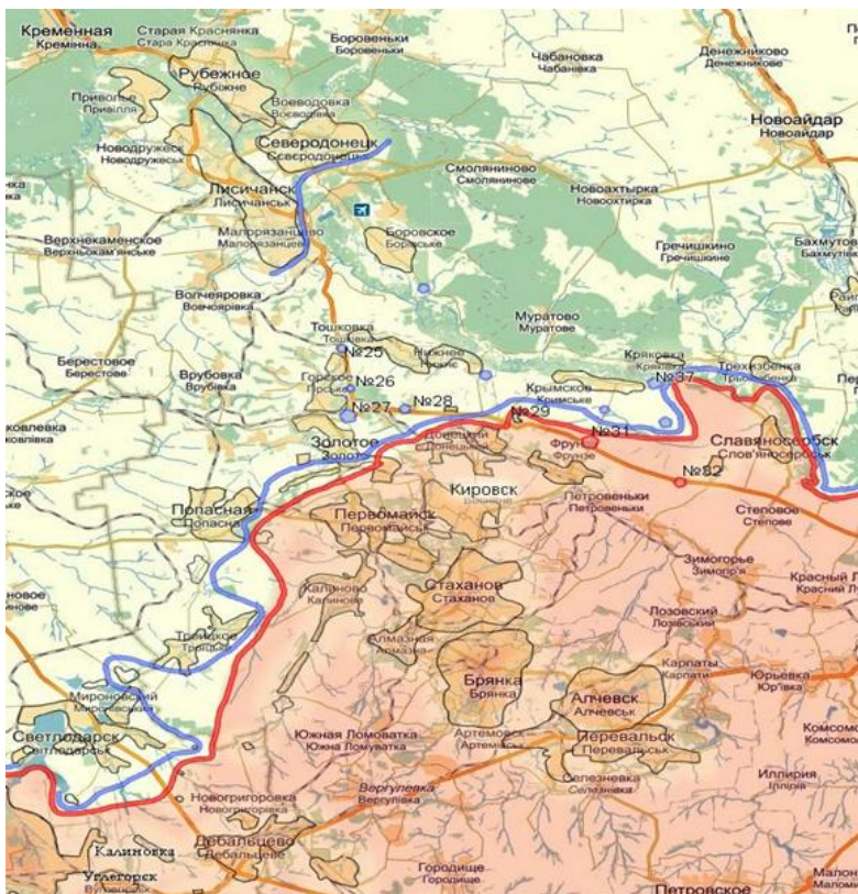
Рис. 2. Лінія розмежування ООС

Лінія розмежування ООС розчленовує дві області Донбасу, блокує ряд автомобільних шляхів та залізницю державного значення. Умовна північ та більша частина с/г земель Луганської області знаходяться під контролем України. Умовний південь та центр не контролюються державою. Лінія зіткнення проходить по межах основних агломераційних утворень та по природних бар'єрах (рис. 2).