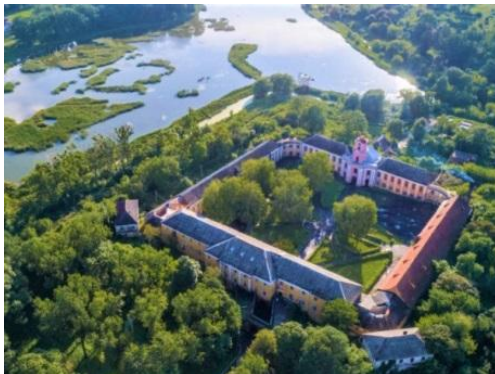
Рис. 3. Олицький замок з висоти пташиного польоту

Пропозиції. Для підкреслення особливостей та покращення статусу смт. Олика потрібно провести такі дії.