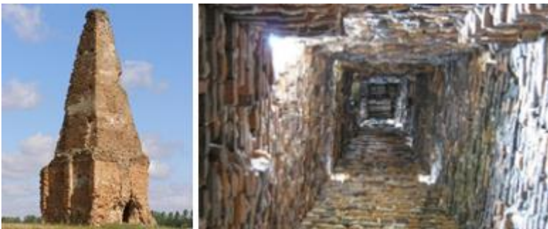
Рис. 6. Мурований стовп

Мурований стовп (рис. 6) вважається найстарішою спорудою в Берестечку. Історія його створення має багато суперечливих теорій і таємниць. Це оригінальний пам'ятник, що має вигляд піраміди з каменю, споруджено на могилі князя Олександра Пронського – сина засновника Берестечка. В середині 16-ти метрової споруди стояла труна з тілом князя, якого згодом поховали. На каменях, з яких виконаний стовп, містить багато написів, датованих XIX століттям, серед яких є навіть автограф польського короля Станіслава Августа Понятовського, який був тут у 1787 році.