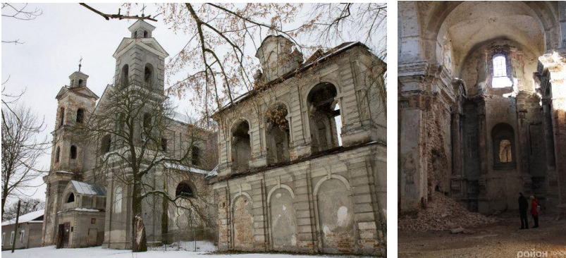
Рис. 3. Сучасний вигляд Троїцького костелу ззовні та всередині

Будівництво Троїцького костелу (рис. 3) стартувало 24 липня 1711 року за кошти, виділені польським діячем Томашем Карчевським. Його зведенням поляки прагнули увічнити перемогу в битві під Берестечком. Храм повинен був стати підтвердженням могутності Речі Посполитої і показати всю велич їхньої віри.