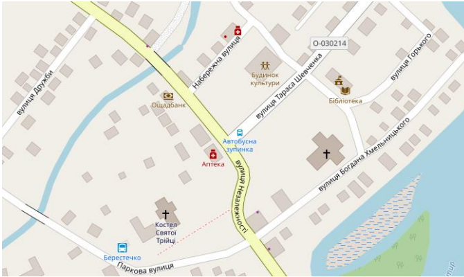
Рис. 2. План загальноміського центру Берестечка

Зупинимось детальніше на кожній історико-архітектурній пам'ятці окремо. Розглянемо Троїцький костел, Свято-Троїцький собор, каплицю Святої Теклі, Мурований стовп - найвизначніші будівлі і споруди міста.